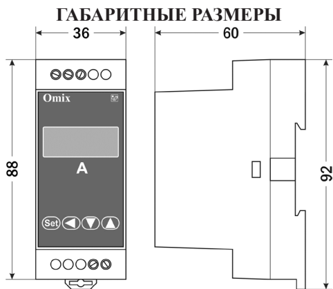
Рис. 2 – Размеры прибора